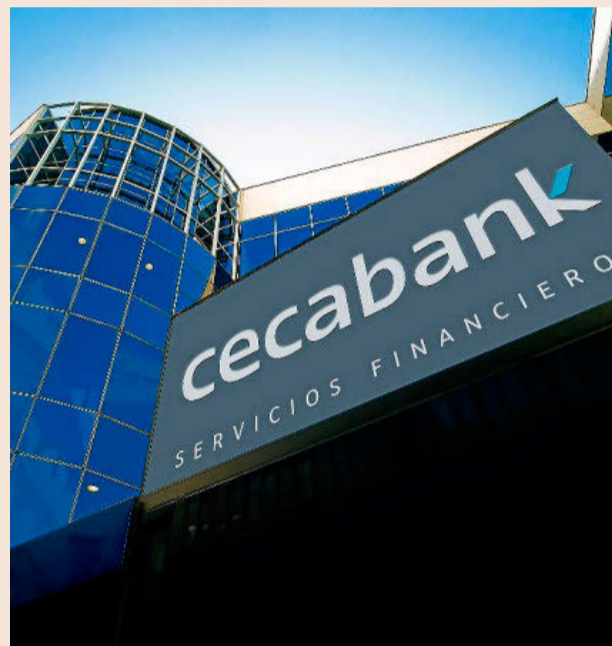
Sede de Cecabank.

También se ha convertido en miembro del mercado, lo que les permite ofrecer la ejecución de órdenes. Es un rol que tenían desde hace dos años, pero que esperan desa-